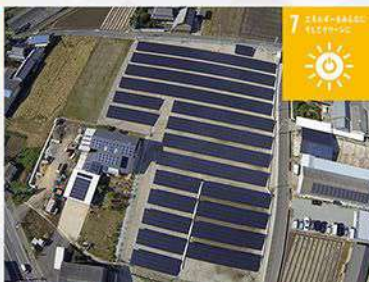
太陽光発電システムを利用し、住宅約300世帯に電気を供給