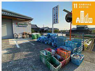
複倉庫駐車場をゴミ回収場所として提供し、ごみの減量化・資源化に貢献