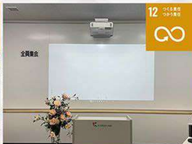
社内会議において資料を紙配布からプロジェクター投影に変更し、環境保護に貢献