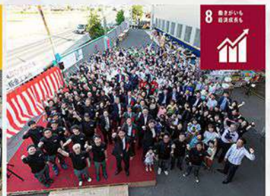
年2回の親睦会の開催や特別休暇制度を導入し、働きやすい環境を構築