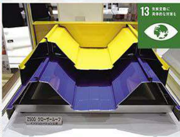
CO2や温室効果ガス排出量の削減に貢献出来る屋根材を開発