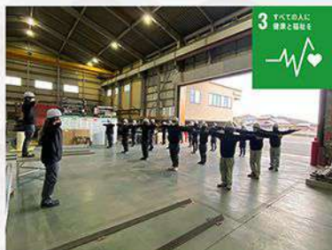
毎朝のラジオ体操や定期健康診断等、健康増進に向けた取り組みを実施