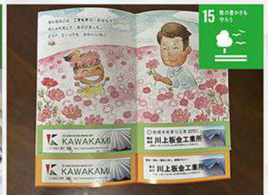
県内の子供達へ花育を推奨する絵本を3.7万冊配布する活動に協力