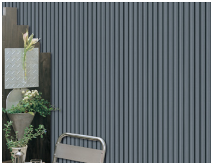
ガンメタルシルバー