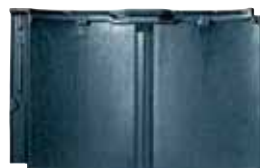
RJ31U モダン・ブラック