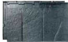
RT31L ストーン・ブラック