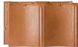
RJ35U モダン・オレンジ