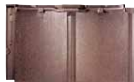
RJ32U モダン・ブラウン