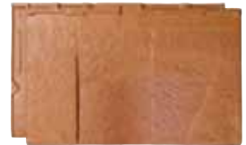
RT35L ストーン・オレンジ