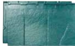
RT34L ストーン・グリーン