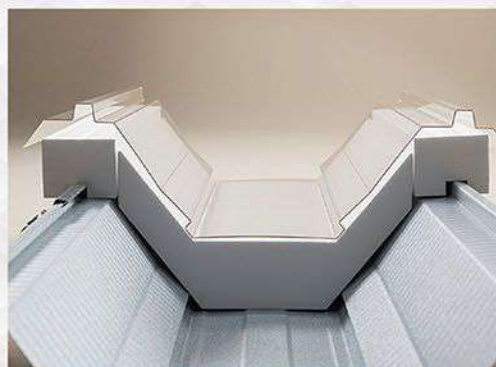
Z500クローザールーフ TYPE-D

折板屋根をサンドイッチ状に積層加工し、上下屋根材の間に断熱材を敷込み、夏は涼しく冬は暖かい室内空間を実現できる「総合的な省エネ型屋根材」の開発を行いました。