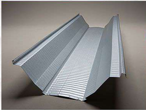
NEW Z500クローザールーフ