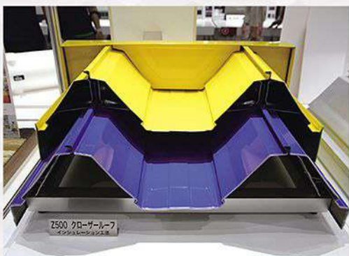
Z500クローザールーフ インシュレーション