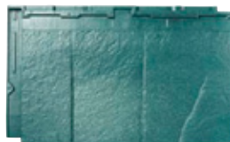
RT34L ストーン・グリーン