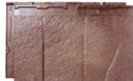
RT32L ストーン・ブラウン