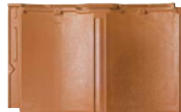
RJ35U モダン・オレンジ