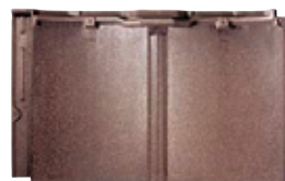
RJ32U モダン・ブラウン