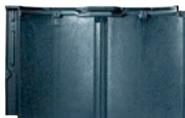
RJ31U モダン・ブラック