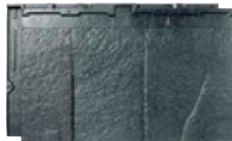
RT31L ストーン・ブラック