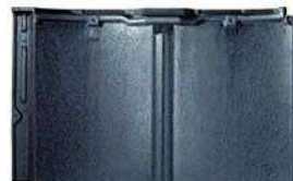
RJ31U モダン・ブラック