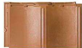
RJ35U モダン・オレンジ