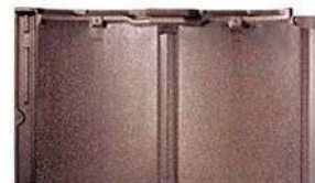
RJ32U モダン・ブラウン