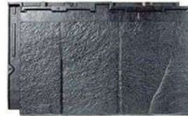
RT31L ストーン・ブラック