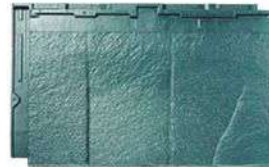
RT34L ストーン・グリーン