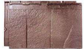
RT32L ストーン・ブラウン