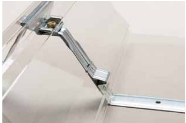
本体はタイトフレームのクローザー金具とガッチリ嵌合