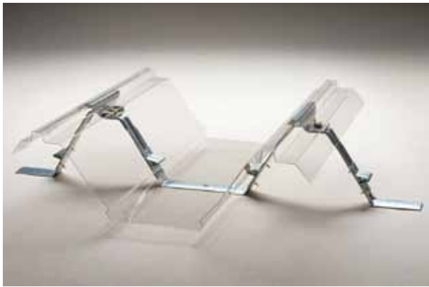
シンプルなスケルトン