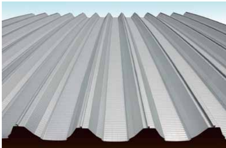
Z500 クローザールーフ TYPE-R