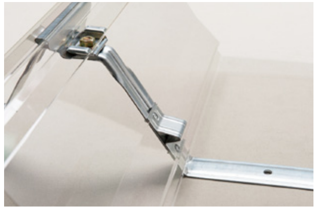
本体はタイトフレームのクローザー金具とガッチリ嵌合