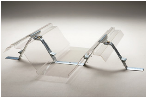
シンプルなスケルトン