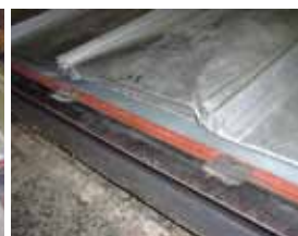
スリムルーフタテヒラ