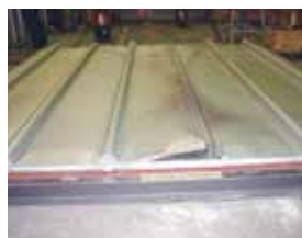
スリムルーフカワラボウ