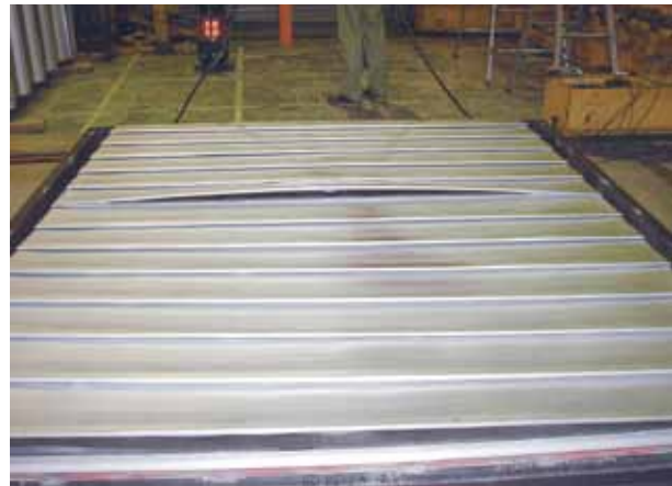
段葺き215試験後の損傷状況