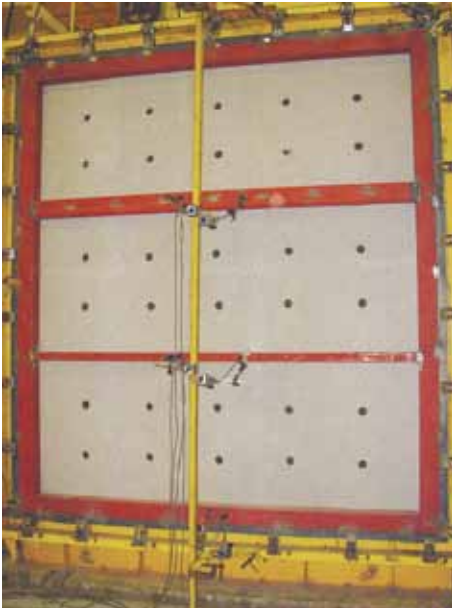
圧力箱に貼り付けられた試験体 （野地板の屋内面が見える）