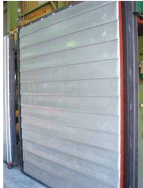
試験体の外観（屋外側）