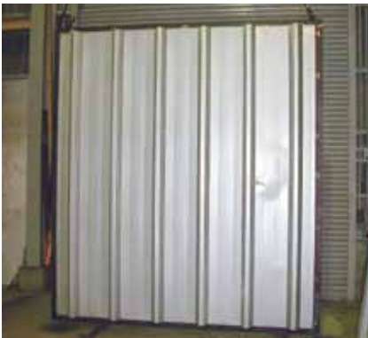
スーパールーフ66の損傷状況