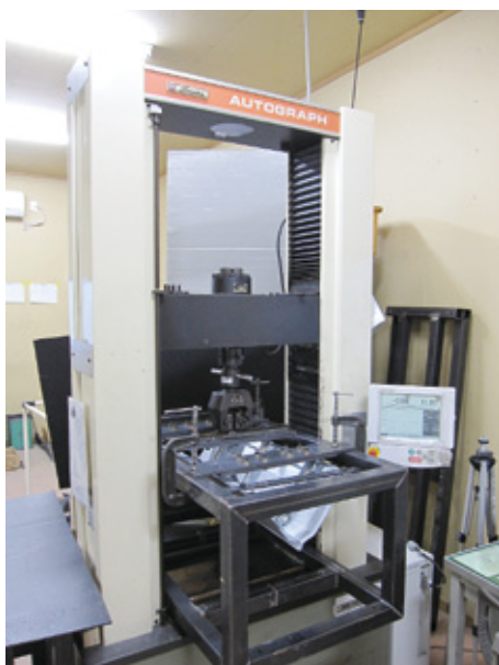
Z500 クローザールーフ吊子引張試験の実施