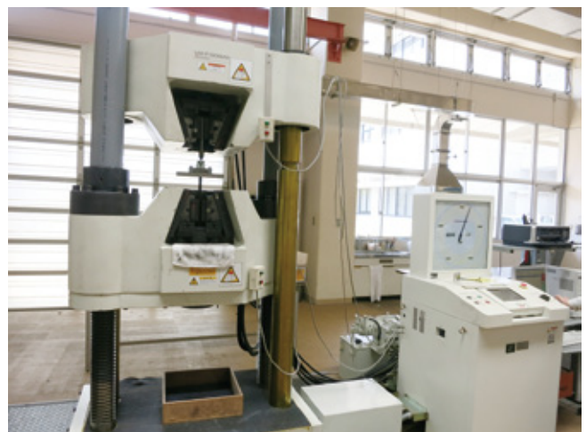
香川県産業技術センターにて 新型インサート引張試験の実施