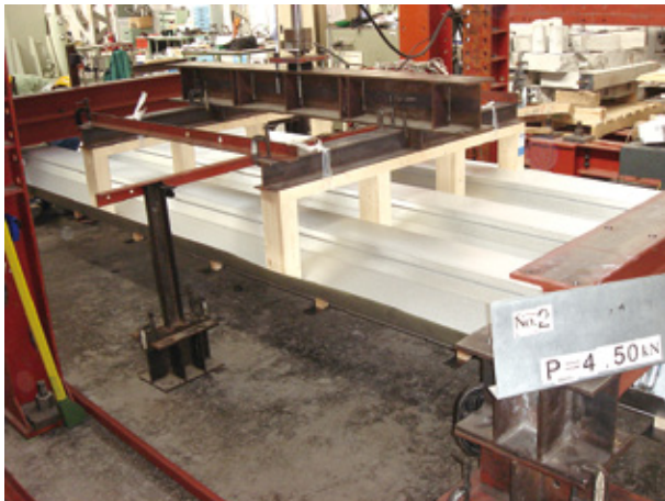
Z500 クローザールーフ (負圧) 曲げ耐力試験