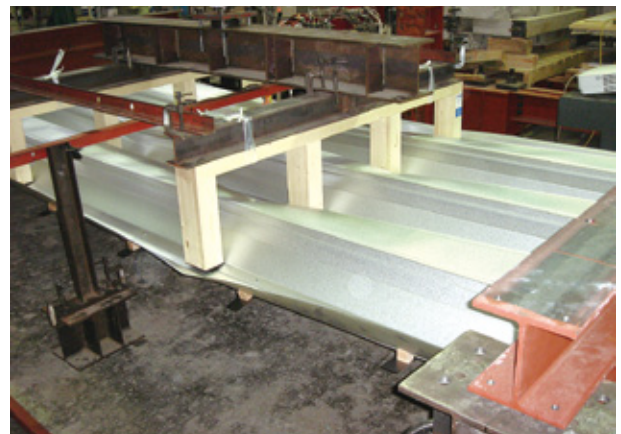
Z500 クローザールーフ損傷状況