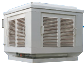
クールルーフファン