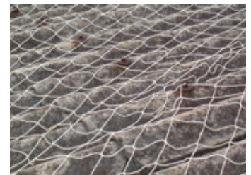
フックボルト切断