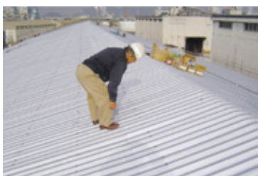
施工完了後、自主検査