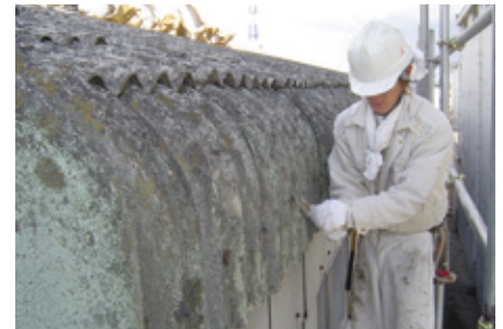
スレート屋根 谷部分清掃