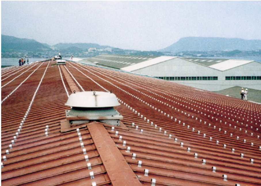
タイトフレーム取付状況