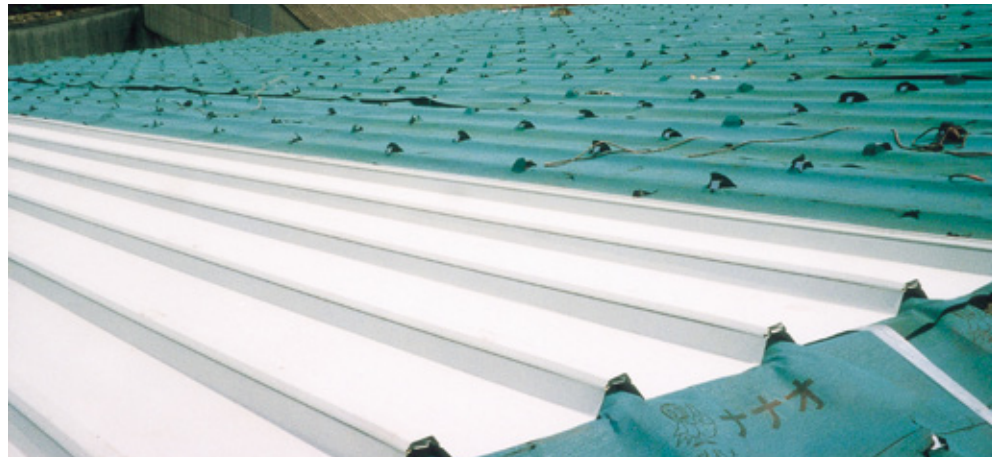
スーパーroof施工状況