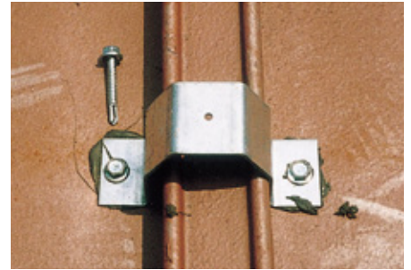
タイトフレーム固定状況