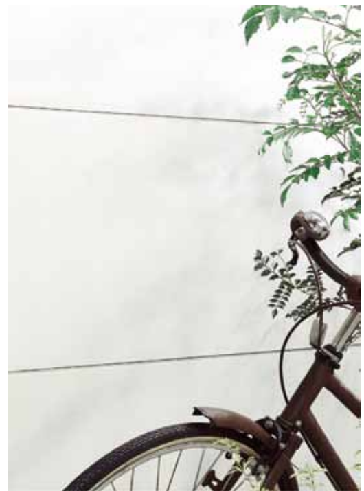
▲打ちコンソノセントホワイトDC/横張り