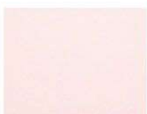
Pパールピンク (ポリ) CFパールピンク (フッ素)