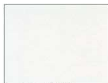
Pホワイト (ポリ) CFホワイト (フッ素)