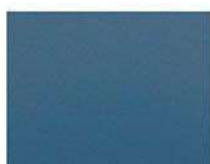
Pグランブルー (ポリ) CFグランブルー (フッ素)

(注) 同じ色名でもポリエステル樹脂塗装品とフッ素樹脂塗装品とは色合いに僅かな差異があります。実物色見本等でご確認ください。