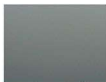
PガングレーM (ポリ)※ CFガングレーM (フッ素)