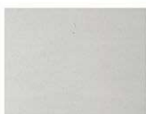
Pグレー (ポリ) CFグレー (フッ素)