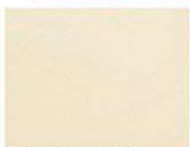
Pアイボリー (ポリ) CFアイボリー (フッ素)