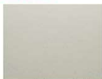
Pシャンパンゴールド (ポリ)※ CFシャンパンゴールド (フッ素)