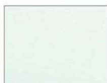
Pアクアブルー (ポリ) CFアクアブルー (フッ素)